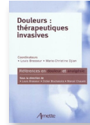
Douleurs : thérapeutiques invasives