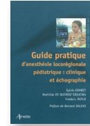
Guide pratique d'anesthésie locorégionale pédiatrique : clinique et échographie