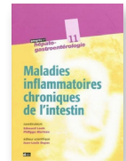
Maladies inflammatoires chroniques de l'intestin