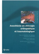
Anesthésie en chirurgie orthopédique et traumatologique